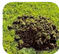
Hoher runder Hügel