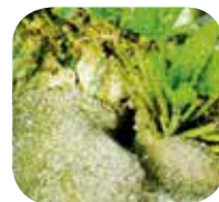
Meist offenes Loch